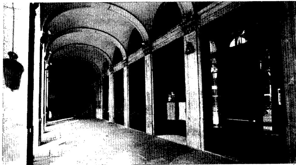
La plaza Reial se empobrece con la pérdida de este establecimiento

Tuvo el acierto de darle no sólo a su trabajo toda la seriedad necesaria, sino que supo hacerlo llegar al público, lo que le granjeó una popu-